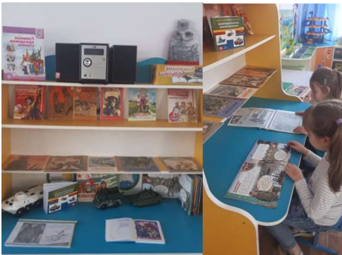
Выставка детской художественной литературы «Защитники Отечества»