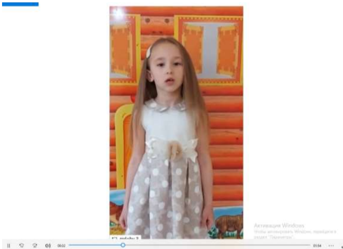
Чтение стихотворение И. Краснова «Праздник бабки Ульяны»