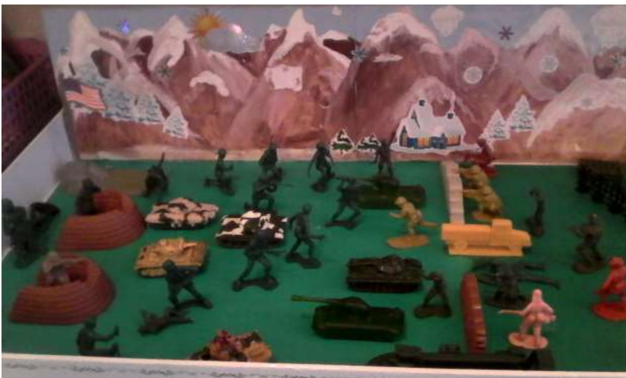
Фрагмент мини музея «Дорогами Победы»