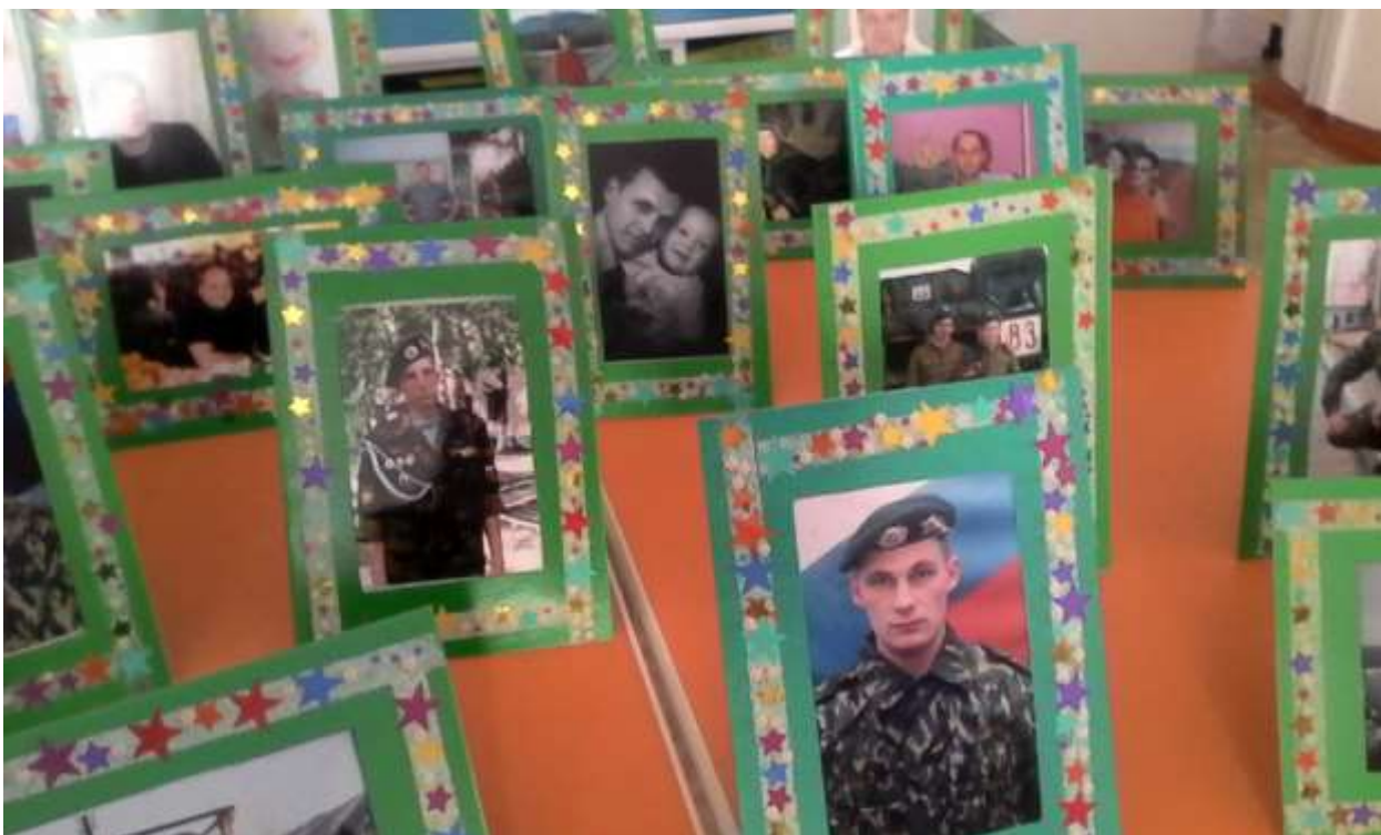
Фотовыставка «Мой папа – солдат!»