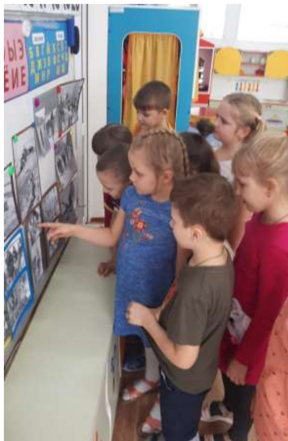
Выбор фотографий для презентации «Детям о Великой Отечественной войне»