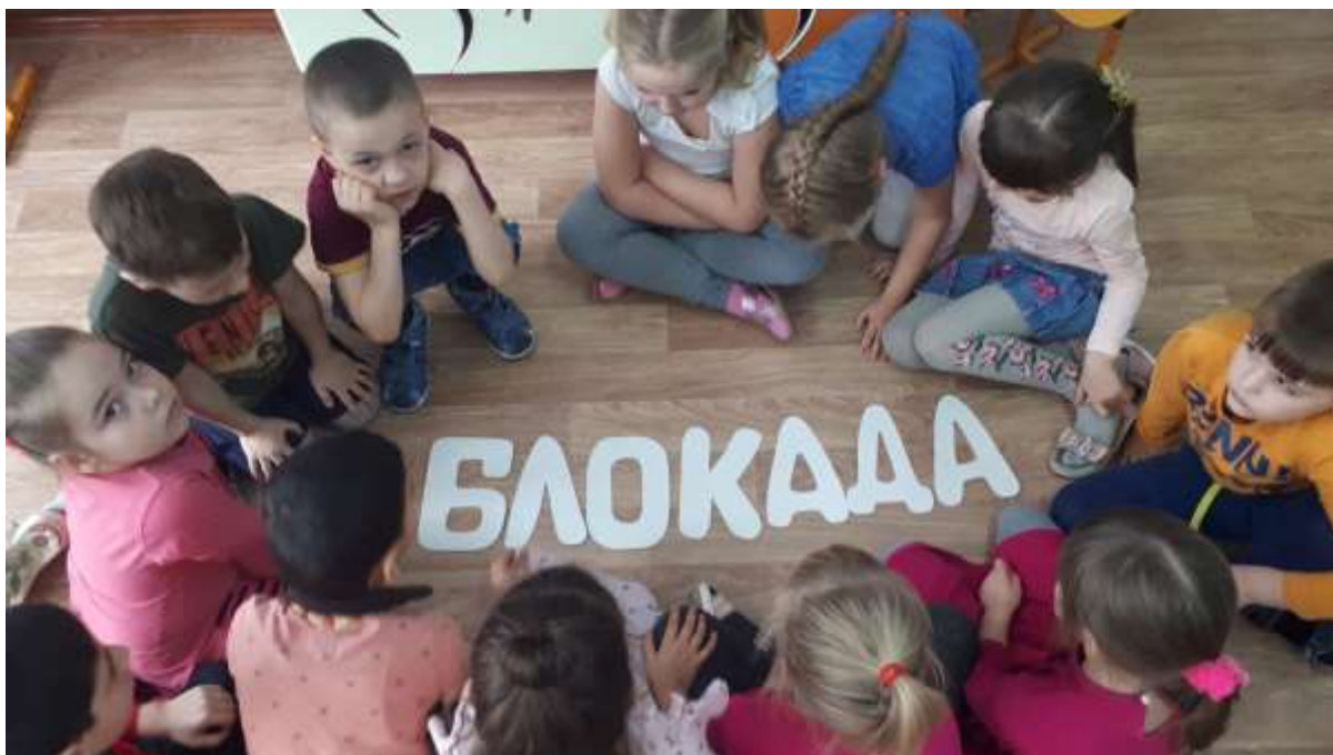
Фрагмент беседы «В блокадном Ленинграде»